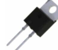
MUR880EG ON Semiconductor DIODE GEN PURP 800V 8A TO220AC