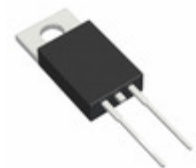
MUR8L60HC0G TSC (Taiwan Semiconductor) DIODE GEN PURP 600V 8A TO220AC