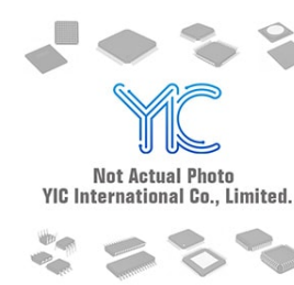
MURA110T3 ON ON DO-214A