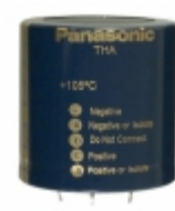
ECE-T1VA223EA Panasonic Electronic Components CAP ALUM 22000UF 20% 35V SNAP