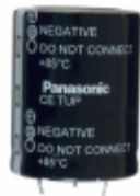
ECE-T1KP103FA Panasonic Electronic Components CAP ALUM 10000UF 20% 80V SNAP