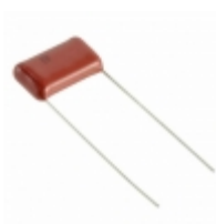
ECQ-E6563RJF Panasonic Electronic Components CAP FILM 0.056UF 5% 630VDC RAD