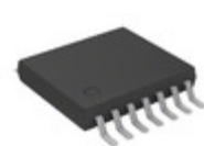
MCP4452-104E/ST Microchip Technology IC RHEO 100K QUAD 8BIT 14TSSOP