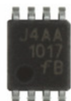
FIN1017K8X Fairchild/ON Semiconductor IC DRIVER 3.3V HS LVDS US8