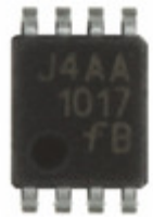
FIN1017K8X AMI Semiconductor / ON Semiconductor IC DRIVER 3.3V HS LVDS US8