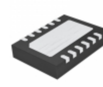
LTC6912IDE-2#TRPBF Linear Technology IC OPAMP PGA 30MHZ RRO 12DFN