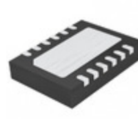
LTC6912IDE-2#TRPBF ADI (Analog Devices, Inc.) IC OPAMP PGA 30MHZ RRO 12DFN