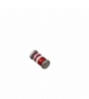
JANTX1N754CUR-1 Microsemi Corporation DIODE ZENER 6.8V 500MW DO213AA