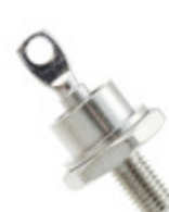
1N3306RA Microsemi Corporation DIODE ZENER 7.5V 50W DO5