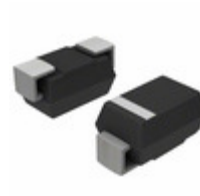
SMBJ5375BE3/TR13 Microsemi Corporation DIODE ZENER 82V 5W SMBJ