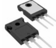
HUF75852G3 Fairchild/ON Semiconductor MOSFET N-CH 150V 75A TO-247