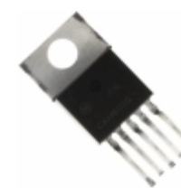
CS8147YTV A5 ON Semiconductor IC REG LDO 10V/5V TO220-5