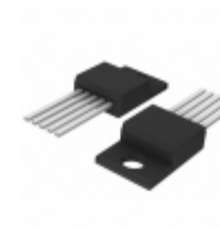
CS8147YT5 ON Semiconductor IC REG LDO 10V/5V TO220-5