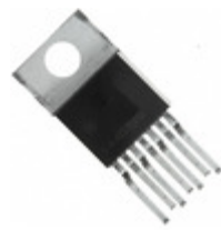
CS8141YTV A7 ON Semiconductor IC REG LDO 5V 0.5A TO220-7