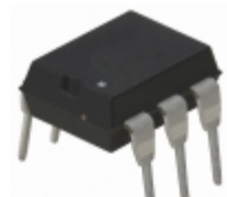
CPC1972G IXYS Integrated Circuits Division SOLID STATE SWITCH 800V 6- DIP