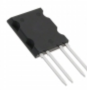
CPC1968J IXYS Integrated Circuits Division RELAY 500V 2A ISOPLUS264