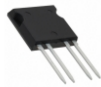
CPC1977J IXYS Integrated Circuits Division RELAY OPTOMOS 1.25A SP-NO 600V