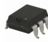
CPC1972GSTR IXYS Integrated Circuits Division SWITCH POWER 250MA 800VAC 6-SMT