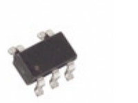
MAX4627EUK+T Maxim Integrated IC SWITCH SPST SOT23-5