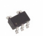
MAX4627EUK-T Maxim Integrated IC SW ANLG 0.5 OHM SPST SOT23-5