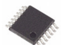
MAX4630EUD Maxim Integrated IC SWITCH QUAD SPST 14TSSOP