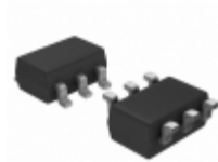
MAX4628EUT-T Maxim Integrated IC SWITCH SPST SOT23-6