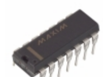
MAX4630EPD Maxim Integrated IC SW QUAD ANLG CMOS SPST 14-DIP