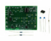
MCP6XXXEV-AMP4 Micrel / Microchip Technology BOARD AMPLIFIER EVAL 4 MCP6XXX