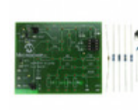
MCP6XXXEV-AMP1 Micrel / Microchip Technology BOARD AMPLIFIER EVAL 1 MCP6XXX