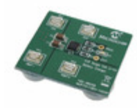
MCP73113EV-1SOVP Micrel / Microchip Technology BOARD EVAL BATT CHARGER MCP73113