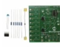
MCP6XXXEV-AMP2 Micrel / Microchip Technology BOARD AMPLIFIER EVAL 2 MCP6XXX