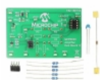
MCP6XXXEV-AMP3 Micrel / Microchip Technology BOARD AMPLIFIER EVAL 3 MCP6XXX