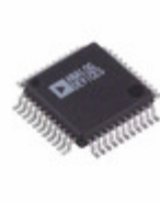
AD7836ASZ Analog Devices Inc. IC DAC 14BIT QUAD LC2MOS 44MQFP