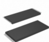
AT28C010-15TI Microchip Technology IC EEPROM 1MBIT 150NS 32TSOP