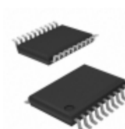
X9241AUVT1 Intersil IC XDCP QUAD 4X50K EE 20-TSSOP