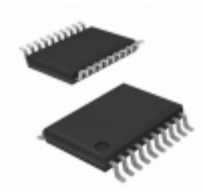
X9241AUVIZT1 Intersil IC XDCP QUAD 4X50K EE 20-TSSOP