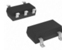
AN80L52RMSTX Panasonic Electronic Components IC REG LDO 5.2V 0.15A MINI5D