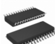
AT27C512R-70RI Micrel / Microchip Technology IC OTP 512KBIT 70NS 28SOIC