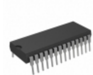
AT27C512R-70PI Micrel / Microchip Technology IC OTP 512KBIT 70NS 28DIP