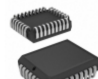
AT27C512R-70JU-T Micrel / Microchip Technology IC OTP 512KBIT 70NS 32PLCC