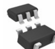
TS971IYLT STMicroelectronics IC OPAMP GP 12MHZ RRO SOT23-5