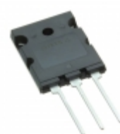
IXTK102N30P IXYS MOSFET N-CH 300V 102A TO-264