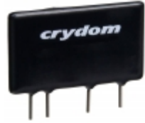
CMXE200D3 Crydom RELAY SSR SPST-NO 200VDC 3A SIP