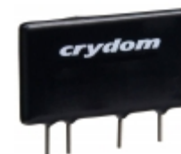
CMXE100D10 Crydom RELAY SSR SPST-NO 100VDC 10A SIP