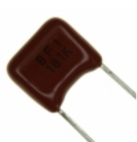
ECQ-B1H181KF Panasonic Electronic Components CAP FILM 180PF 10% 50VDC RADIAL