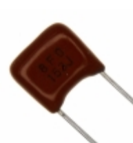
ECQ-B1H153JF Panasonic Electronic Components CAP FILM 0.015UF 5% 50VDC RADIAL