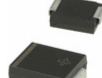
SMCJ78CA-M3/57T Electro-Films (EFI) / Vishay TVS DIODE 78V 126V DO214AB