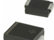
SMCJ78CAHE3/9AT Vishay Semiconductor Diodes Division TVS DIODE 78VWM 126VC SMC