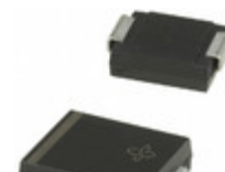
SMCJ78CAHE3/9AT Electro-Films (EFI) / Vishay TVS DIODE 78V 126V DO214AB