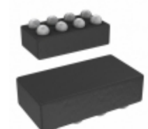
MAX44285HAWA+T Maxim Integrated IC AMP CURRENT SENSE 8WLP