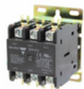
GDP323L120V Carlo Gavazzi 3P DPC LUG TERM 32A 120VAC