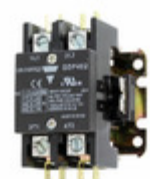
GDP402L120V Carlo Gavazzi 2P DPC LUG TERM 40A 120VAC