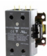
GDP402S120V Carlo Gavazzi 2P DPC SCRW TERM 40A 120VAC