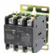
GDP323L24V Carlo Gavazzi 3P DPC LUG TERM 32A 24VAC