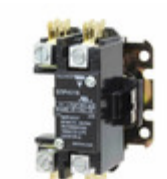
GDP401SL120V Carlo Gavazzi 1P+S DPC LUG TERM 40A 120VAC