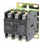
GDP323L220V Carlo Gavazzi 3P DPC LUG TERM 32A 220VAC