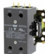
GDP322S24V Carlo Gavazzi 2P DPC SCRW TERM 32A 24VAC