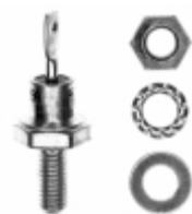
VS-1N3892 Vishay Semiconductor Diodes Division DIODE GEN PURP 300V 12A DO203AA