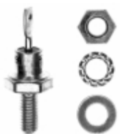
VS-1N3891R Electro-Films (EFI) / Vishay DIODE GEN PURP 200V 12A DO203AA