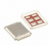
IRF7780MTRPBF Infineon Technologies MOSFET N-CH 75V 89A