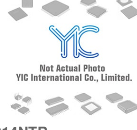
AUIRFL014NTR. IR IR SOT223