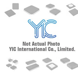
AUIRFL014NTRPBF IR AUIRFL014NTRPBF IR