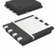
AUIRFN7107TR International Rectifier (Infineon Technologies) MOSFET N-CH 75V 75A 8PQFN