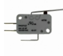
D44L-R1LD ZF Electronics SWITCH SNAP ACTION SPDT 10A 125V