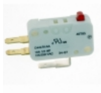
D44L-R1AA ZF Electronics SWITCH SNAP ACTION SPDT 10A 125V