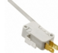
D44L-R1ML ZF Electronics SWITCH SNAP ACTION SPDT 10A 125V