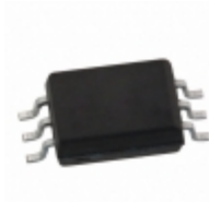
ACPL-W50L-560E Avago Technologies (Broadcom Limited) OPTOISO 5KV TRANS 6-SO STRETCHED