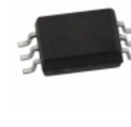
ACPL-W60L-500E Avago Technologies (Broadcom Limited) OPTOISO 5KV OPN COLL 6SO