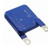
LS40K320QPK2 EPCOS (TDK) VARISTOR 510V 40KA CHASSIS