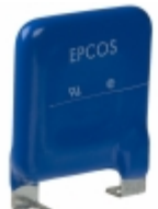
LS40K275QP EPCOS (TDK) VARISTOR 430V 40KA CHASSIS