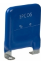
LS40K250QP EPCOS (TDK) LS40K250QP EPCOS (TDK)