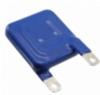
LS40K250QPK2 EPCOS (TDK) VARISTOR 390V 40KA CHASSIS