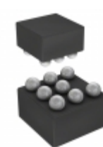
SST25VF040B-50-4C-ZAE Microchip Technology IC FLASH 4MBIT 50MHZ 8CSP