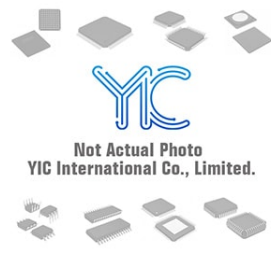
BR24G256FJ-3 ROHM BR24G256FJ-3 ROHM