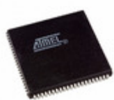
AT40K05LV-3AJC Microchip Technology IC FPGA 3.3V 256 CELL 84-PLCC