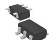
AD8009JRTZ-R2 Analog Devices Inc. IC OPAMP CF LDIST 175MA SOT23-5