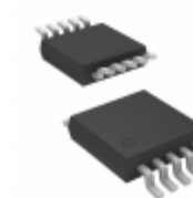
AD5426YRMZ-REEL7 Analog Devices Inc. IC DAC 8BIT MULTIPLYING 10MSOP