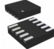
MIC5315-GGCYMT-TR Microchip Technology IC REG LDO 1.8V 1.8/1V 10TMLF