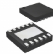
MIC5316-GGCYMT-TR Microchip Technology IC REG LDO 1.8V 1.8/1V 12TMLF