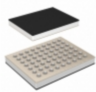
BD57015GWL-E2 Rohm Semiconductor IC WIRELESS PWR REC UCSP50L4C