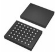
BD57011AGWL-E2 LAPIS Semiconductor IC WIRELESS PWR RCVR UCSP50L3C