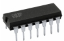
HEF4081BP,652 NXP USA Inc. IC GATE AND 4CH 2-INP 14-DIP