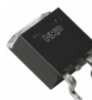
BUJ105AB,118 WeEn Semiconductors TRANS NPN 400V 8A D2PAK