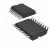
PIC16LF819T-I/SO Microchip Technology IC MCU 8BIT 3.5KB FLASH 18SOIC