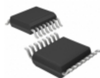
LT6232CGN#TRPBF Linear Technology IC OPAMP GP 215MHZ RRO 16SSOP