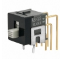
AS222AV NKK Switches SWITCH SLIDE DPDT 0.4VA 28V