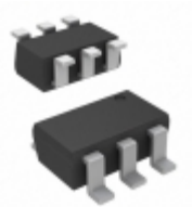
AS222-92LF Skyworks Solutions Inc. IC SW SPDT 0.1-3GHZ GAAS SC70-6