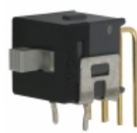
AS222AH NKK Switches SWITCH SLIDE DPDT 0.4VA 28V