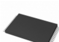
AT28HC64B-90TU-T Micrel / Microchip Technology IC EEPROM 64K PARALLEL 28TSOP