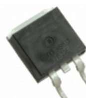
IXFA4N85X IXYS MOSFET N-CH 850V 3.5A TO263-3