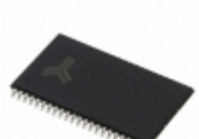
AS7C1026B-15TCN Alliance Memory, Inc. IC SRAM 1MBIT 15NS 44TSOP