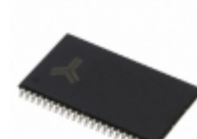
AS7C1026B-15TCNTR Alliance Memory, Inc. IC SRAM 1MBIT 15NS 44TSOP