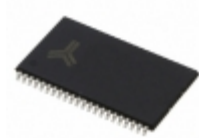
AS7C1026B-20TCN Alliance Memory, Inc. IC SRAM 1MBIT 20NS 44TSOP