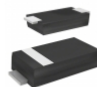
CZRA4735-G Comchip Technology DIODE ZENER 6.2V 1W DO214AC