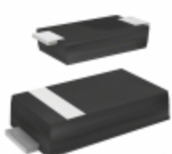
CZRA4736-G Comchip Technology DIODE ZENER 6.8V 1W DO214AC