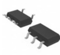
LT1783CS5#TRMPBF ADI (Analog Devices, Inc.) IC OPAMP GP 1.3MHZ RRO TSOT23-5