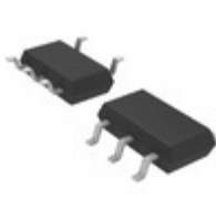
LT1783CS5#TRMPBF Linear Technology IC OPAMP GP 1.3MHZ RRO TSOT23-5