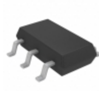
LT1783CS6#TRMPBF ADI (Analog Devices, Inc.) IC OPAMP GP 1.3MHZ RRO TSOT23-6