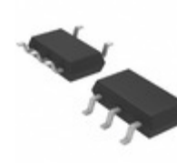
LT1783CS5#TRPBF Linear Technology IC OPAMP GP 1.3MHZ RRO TSOT23-5