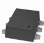
ADG859RYZ-REEL7 Analog Devices Inc. IC SWITCH SPDT SOT66