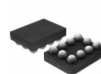
ADG884BCBZ-REEL7 Analog Devices Inc. IC SWITCH DUAL SPDT 10WLCSP