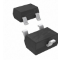
MMBZ5230BW-7-F Diodes Incorporated DIODE ZENER 4.7V 200MW SOT323