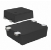
S-1000N20-I4T1U SII Semiconductor Corporation IC VOLT DETECT N-CH 20V SNT-4A