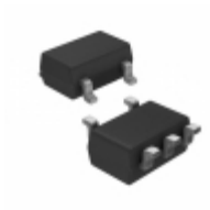
S-1000N20-M5T1G SII Semiconductor Corporation IC VOLT DETECT N-CH 20V SOT23-5